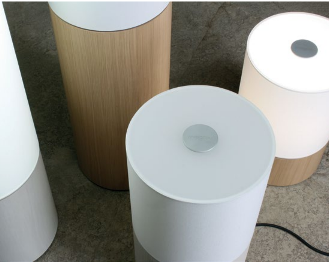
table lamps: 18 watt (light colour warm white)

floor lamps: 36 watt (light colour warm white)